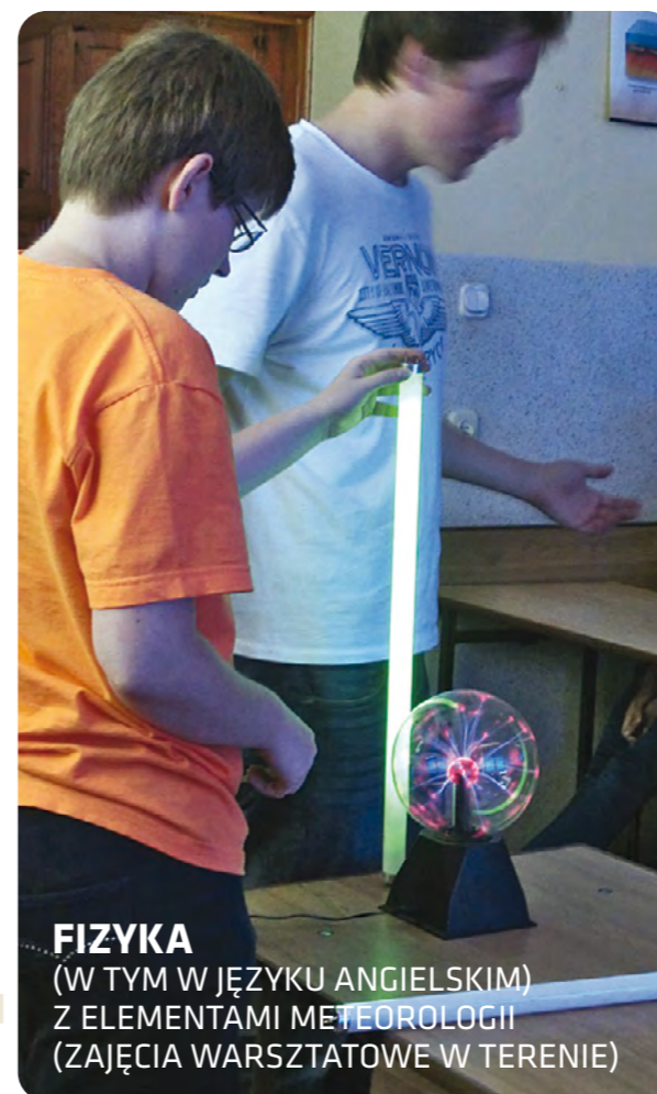
FIZYKA (W TYM W JĘZYKU ANGIELSKIM) Z ELEMENTAMI METEOROLOGII (ZAJĘCIA WARSZTATOWE W TERENIE)