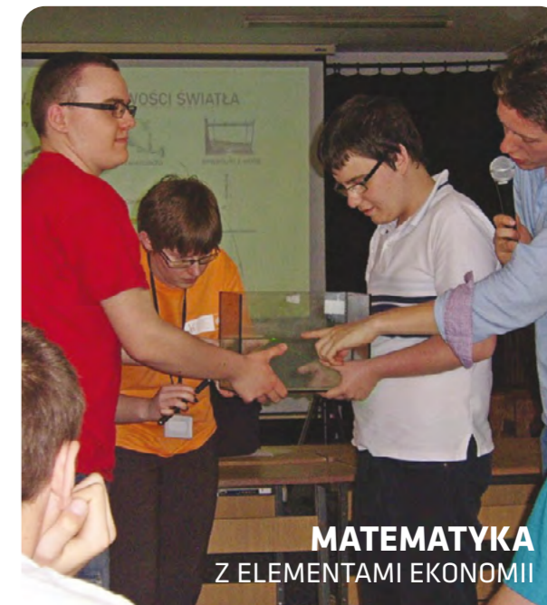
MATEMATYKA Z ELEMENTAMI EKONOMII